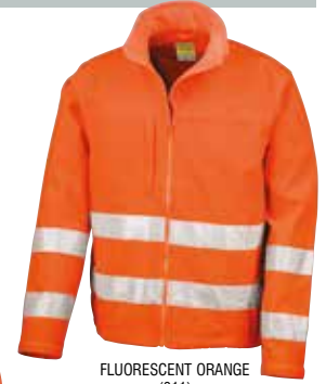
FLUORESCENT ORANGE (811)