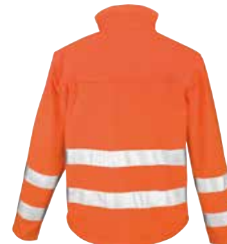
Fashionable shaped longer back panel